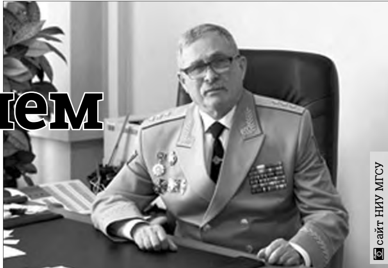
сайт НИУ МГСУ

– «Магнитогорский ГИПРОМЕЗ», безусловно, входит в число организаций, имеющих право и все соответствующие допуски на проведение таких обследований и мониторингов, но на самом деле эта работа только начинается. Сейчас идет обследование заселенных секций и тех квартир, что находятся далеко от зо-